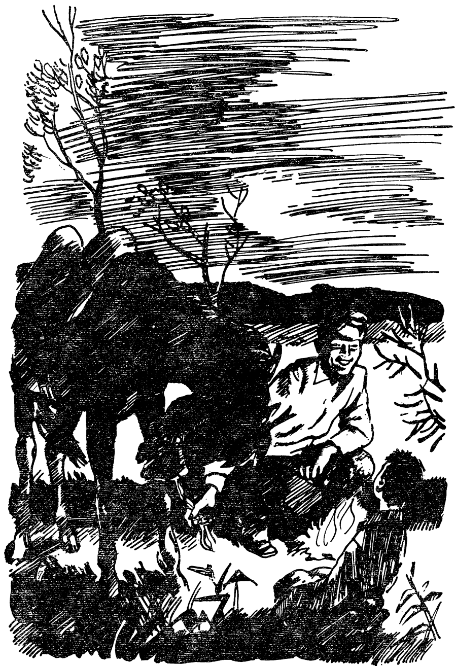
Парнишка смотрел на Метелицу с серьёзным и радостным изумлением.